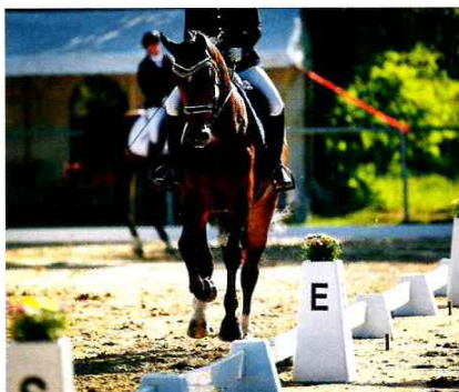
Wo das Hauptaugenmerk eines Richters in Dressurprüfungen liegt, erfahren PM in Zweibrücken vom internationalen Grand Prix-Richter Dr. Dietrich Plewa.

individuell auf den jeweiligen Schüler bzw. das jeweilige Pferd und auf die konkrete Situation abzustimmen. Im zweiten Teil wird dieses Wissen mit unterschiedlichen Reitern und Pferden in die Praxis umgesetzt.